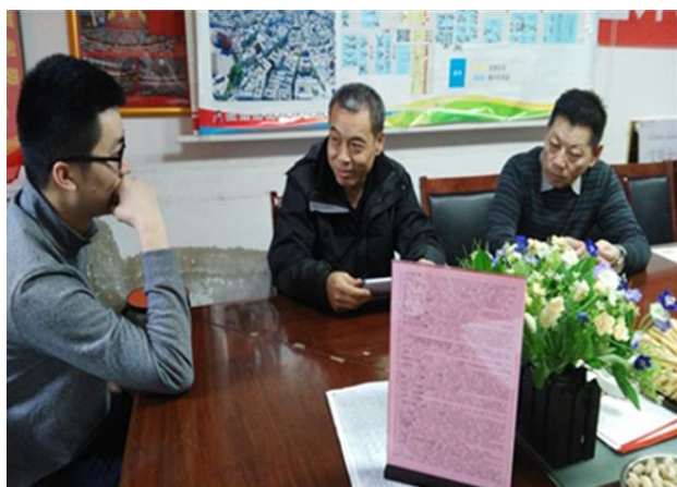
赴乌鲁木齐新市区长春中路片区 新和社区调研