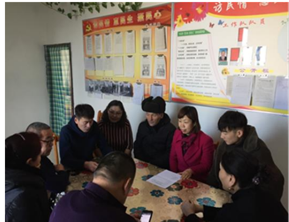
赴福海县阔克阿尕什乡阔克卓尔苏村 村委调研