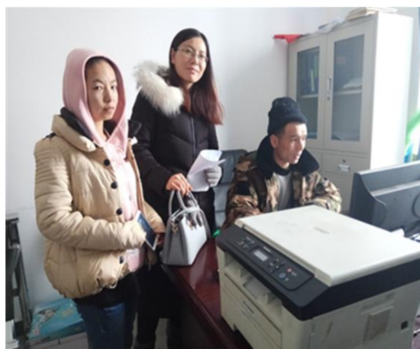
赴伊宁市上阿布拉什村委调研