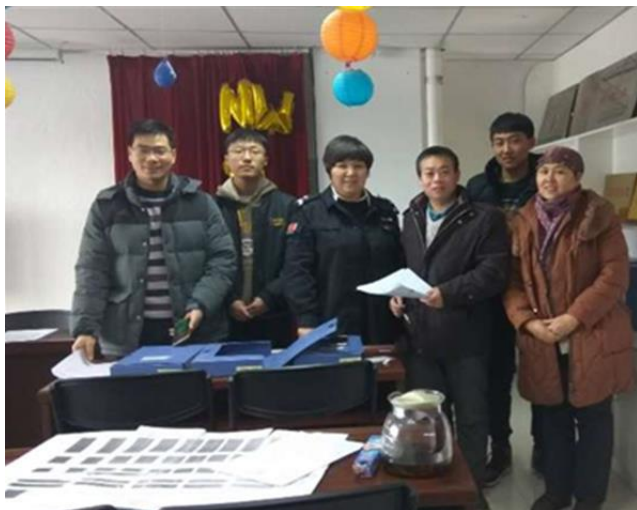
赴乌鲁木齐市米东区安居社区调研