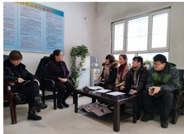
赴米泉市上沙河村村委调研