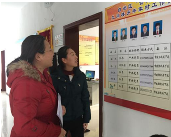
赴乌苏市政协驻九间楼乡毕家村调研