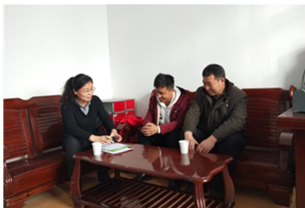
赴军户农场十连调研