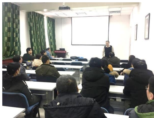
理学院和高职学生结对的教师 家访联谊动员大会