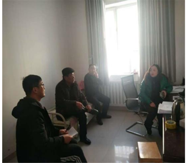
与塔城恰夏镇恩喀德克村驻村工作队交流