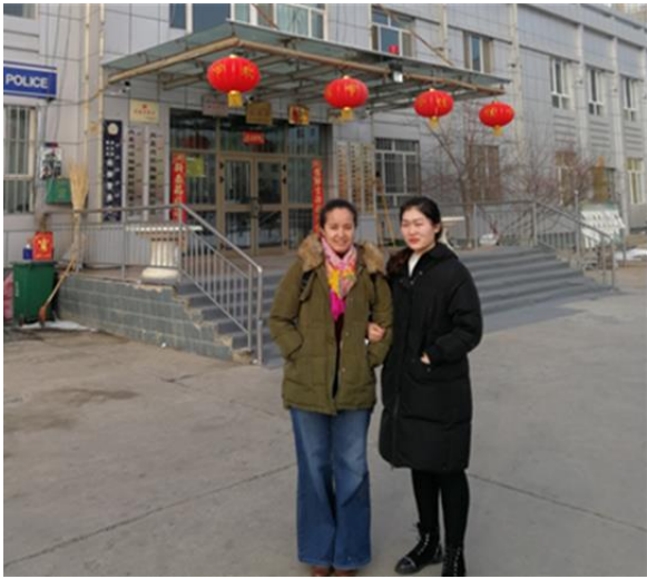
赴奇台西北湾杨柳村村委调研