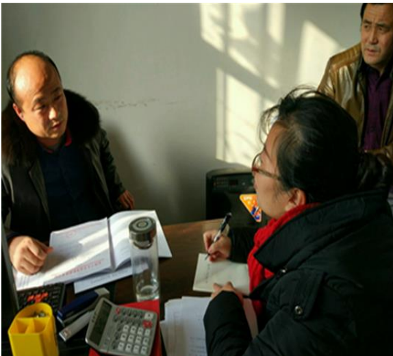
赴军户农场二连调研