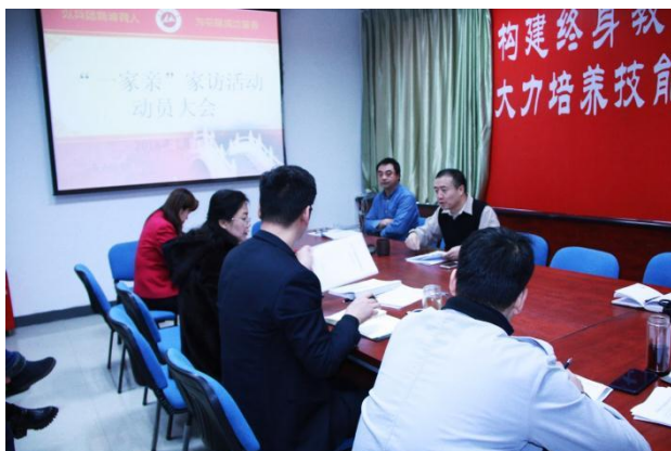
本学院教职工家访联谊动员大会