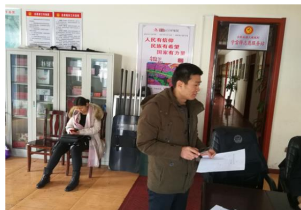
赴米泉市大破城村委调研